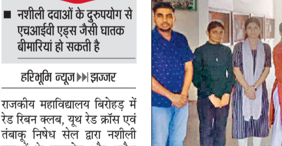
झज्जर। कार्यक्रम में उपस्थित विद्यार्थी एवं शिक्षक।

राजकीय महाविद्यालय बिरौहड़ में रेंड रिबन क्लब, यूथ रेड क्रॉस एवं तंबाकू निषेध सेल द्वारा नशीली दवाओं के दुरुपयोग और अवैध व्यापार के खिलाफ जागरूक किया गया। अंतरराष्ट्रीय नशा निषेध दिवस