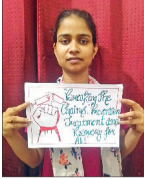
बहादुरगढ़। नशा विरोधी पोस्टर दिखाती वीएड छात्रा।