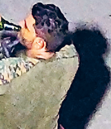
बहादुरगढ़। सड़क पर ही बोतल मुंह पर लगाकर शराब पीता एक युवक।

ब्राउनशुगर, हेरोइन जैसा हार्ड नशा भी बढ़ रहा है। नशे की जड़ें बच्चों से लेकर बुजुर्गों तक में फैल रही हैं। क्षेत्र में इन दिनों किशोरों से लेकर छोटे बच्चों में नशे की लत चिंता का विषय बनता जा रहा है। बाजार में सहज उपलब्ध खांसी की दवाई से लेकर नेल पॉलिश उतारने के केमिकल का नशे के रूप में घड़ल्ले से उपयोग हो रहा है। बाल उम्र में बच्चों को यूं नशे की लत में पड़ जाना भविष्य के लिए काफी खतरनाक है।