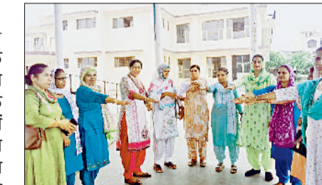
झज्जर। पद एवं गोपनीयता की शपथ लेते हुए नवनिर्वाचित पदाधिकारी।