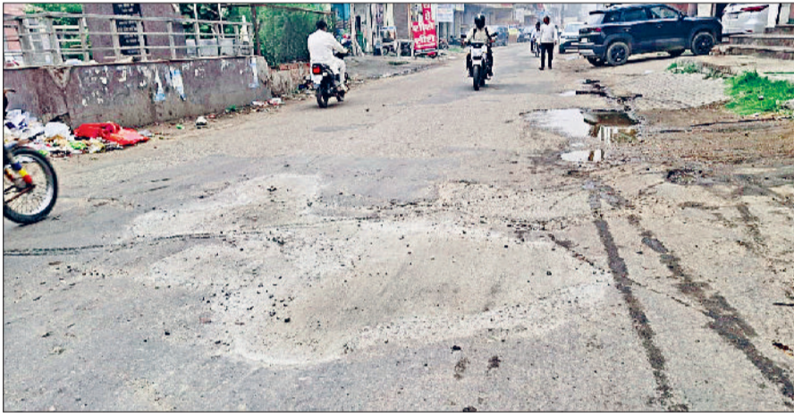
झज्जर। एक सड़क पर किया गया पैचवर्क, जिसमें खानापूर्ति साफ नजर आ रही है।

लोग बोले सामग्री की गुणवत्ता पर भी ध्यान नहीं दिया जा रहा आज समाधान शिविर में रखी जाएगी शिकायत