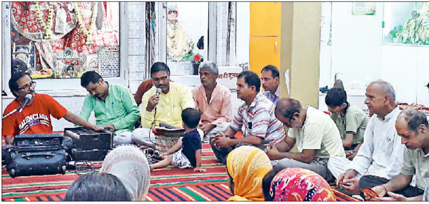
झज्जर। बाबा काशीगिरी मंदिर में भजनों का आनंद लेते हुए श्रद्धालु।