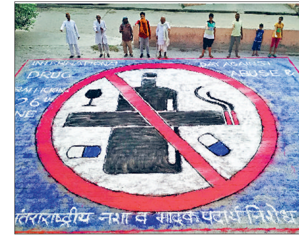
झज्जर। भदना गांव की चौपाल में बनाया गया विशाल रेखाचित्र।

लगाया गया है, ताकि वायु प्रदूषण को रोका जा सके और जनस्वास्थ्य की रक्षा की जा सके। उन्होंने बताया कि सर्वोच्च न्यायालय द्वारा दिए गए निर्देशों के अनुपालन में पटाखों से संबंधित नियमों का सख्ती से पालन सुनिश्चित करने के लिए जिला व खंड स्तर पर शिकायत निवारण समितियों का गठन किया गया है। जिला उपायुक्त ने 3 जून को जिला व ब्लॉक स्तर पर एनफोर्समेंट टीम गठित की। जिलास्तरीय टीम की अध्यक्षता जिला उपायुक्त करेंगे। एचएसपीसीबी के आरओ इसके संयोजक बनाए गए हैं। जबकि पुलिस आयुक्त, डीएमसी, दमकल उपनिदेशक, इंडस्ट्रीज के जिलाधिकारी, डीईओ, पीईएसओ