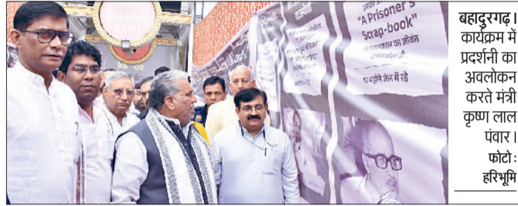
बहादुरगढ़। कार्यक्रम के दौरान मंचासीन कैबिनेट मंत्री व अन्य भाजपाई।