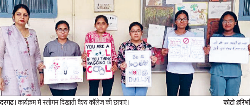
बहादुरगढ़। कार्यक्रम में स्लोगन दिखाती वैश्य कॉलेज की छात्राएं।