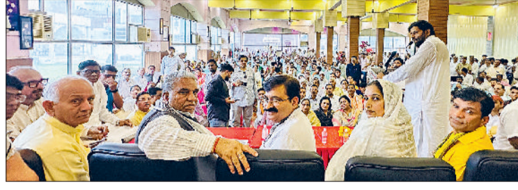
बहादुरगढ़। कार्यक्रम के दौरान मंचासीन कैबिनेट मंत्री व अन्य भाजपाई।