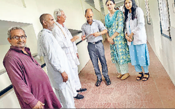
झज्जर। अस्पताल परिसर में धूम्रपान करने वाले लोगों के चालान करते हुए टीम सदस्य।

नशा करने से व्यक्ति का स्वास्थ्य बिगड़ने के साथ-साथ उसका परिवार भी बिखर जाता है